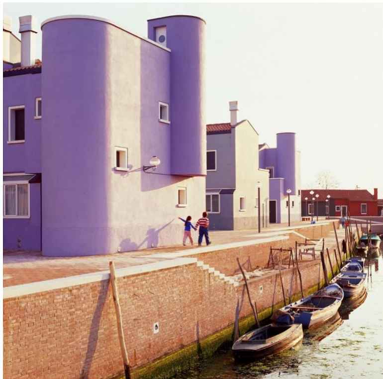
“La fotografia è anche un atto poetico” – Mazzorbo, 1986

Ho intenzione di ripassare ancora nel prossimo futuro: si è instaurato con Mazzorbo un legame familiare.