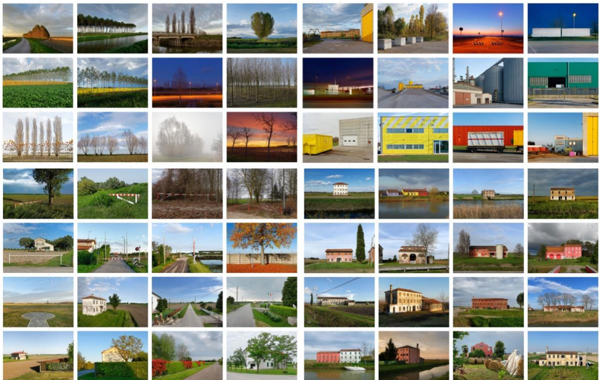
Luce Veneta , il territorio del Basso Piave, 2014-2020

Quindi da osservatore partecipante arrivo, quando necessario, ad una posizione critica.