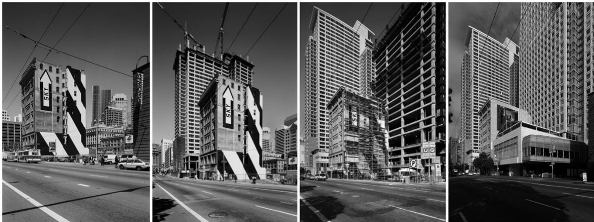
San Francisco Yerba Buena, Sky , artwork by Rigo 23 – 1999, 2001, 2003, 2016

In quest'ottica le mie fotografie di architettura possono essere viste come “ritratti ambientati”.