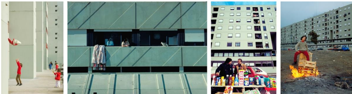
Periferia romana , 1983

Non c’è stata una mia specifica attenzione sulla vita quotidiana, la presenza degli abitanti nelle immagini è stata spontanea, e non l’ho esclusa dalla documentazione.