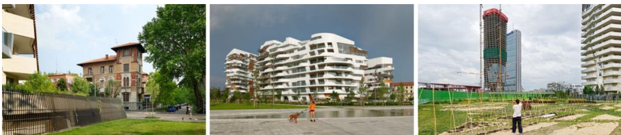
Da Milano la Nuova , Citylife: 1) Il salto 2) C’mon! 3) Attorcigliare

Nella mia recente ricerca Milano la nuova , sui nuovi quartieri di Milano (assolutamente non di edilizia popolare), Citylife e Porta Nuova, la presenza umana mi è invece servita come “gnomone”, cioè come indicatore di un senso specifico della rappresentazione dello spazio, critico, ironico o a volte solo contemplativo, insomma l’umanità nella sua interazione spaziale connota l’estetica formale.